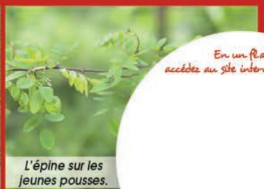
L'épine sur les jeunes pousses.