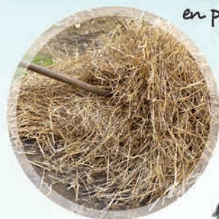
Toiture en paille