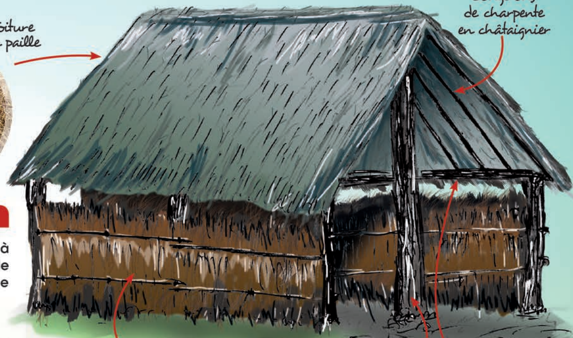
Longerons de charpente en châtaignier