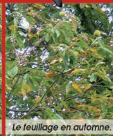
Le feuillage en automne.