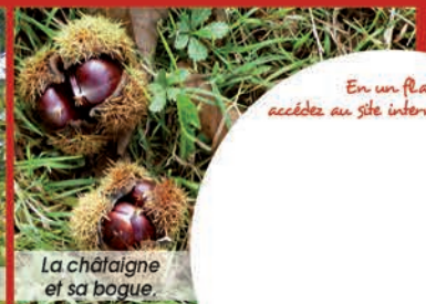
La châtaigne et sa bogue.