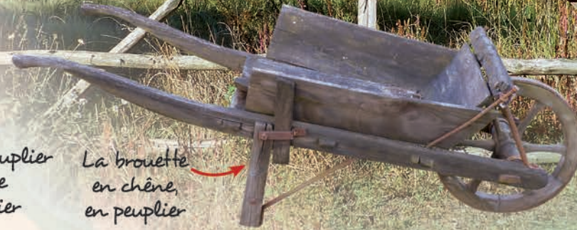
La brouette en chêne, en peuplier