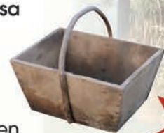
Le baquet en peuplier avec l'anse en châtaignier