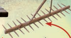
Le rateau ou « ratia » en châtaignier