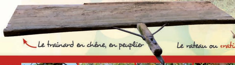
Le trainard en chêne, en peuplier